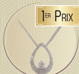
PENDENTIF HAUTE JOAILLERIE