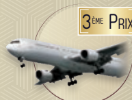
BILLET D'AVION : ALLER RETOUR FR/IS