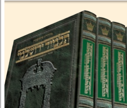
YEROUCHALMI EN HEBREU