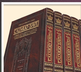
GUEMAROT EN FRANCAIS