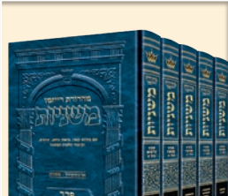
MICHNA EN HEBREU