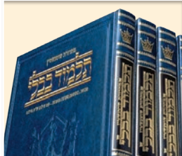
CHASS EN HEBREU